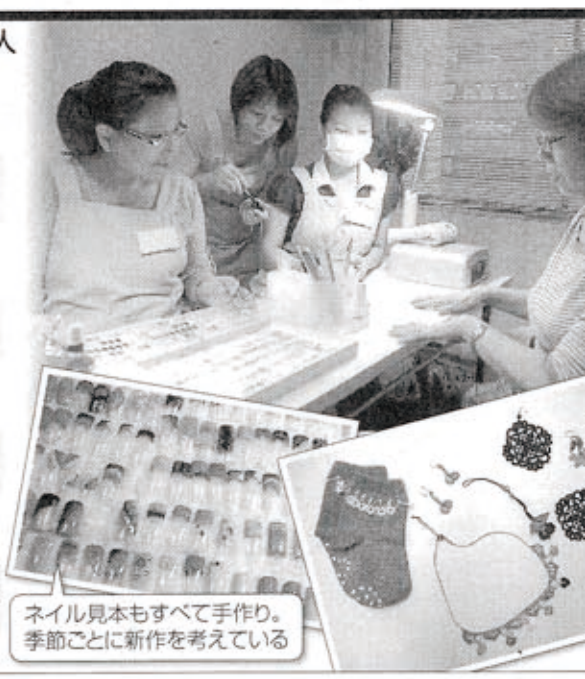
ネイル見本もすべて手作り。季節ごとに新作を考えている

クルド民族の伝統的レース編み「オヤ」の技術で作った商品の数々。ピアスにネックレス、携帯電話ストラップ